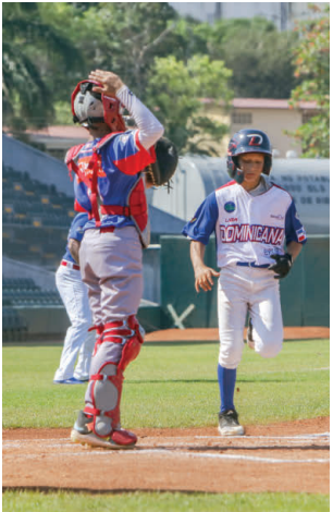
Dominicana anota carrera.