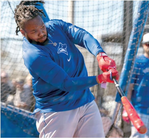
Vladimir Guerrero Jr. bateó .463 durante los entrenamientos.

“Trabajé fuerte en la temporada muerta, cumplí todas mis metas en la tempo-